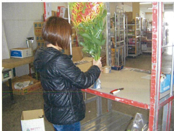
エコゼリー装着中