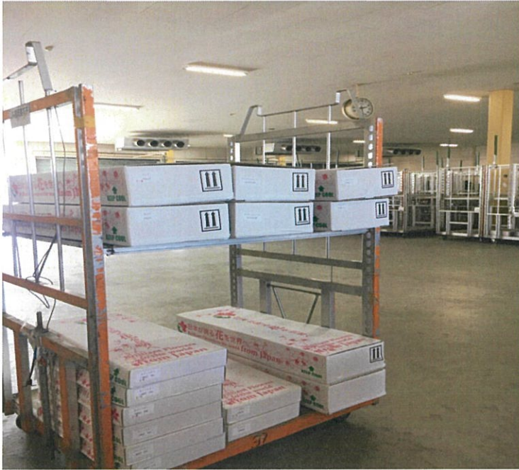
空港に配送 自社便にて