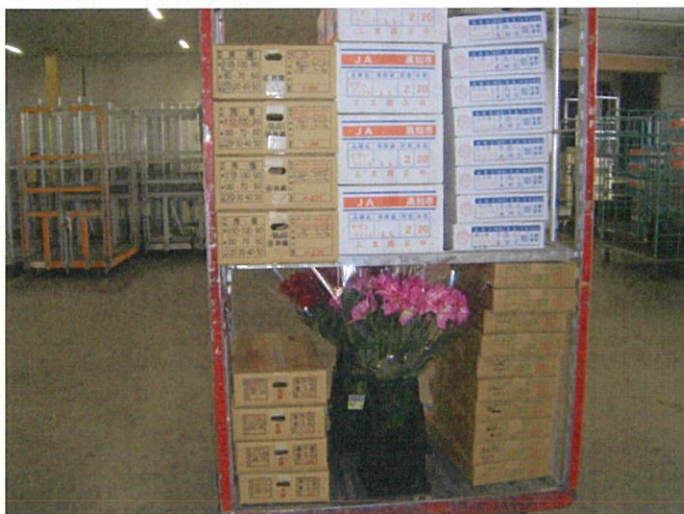
2月27日(月) 商品全体像