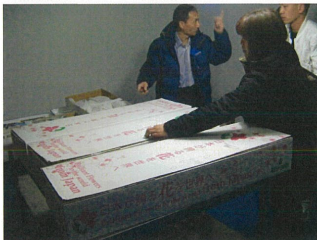
全商品良い状態で検疫を受ける 扱いが雑