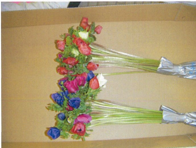
(画像3 上シート、下既存)