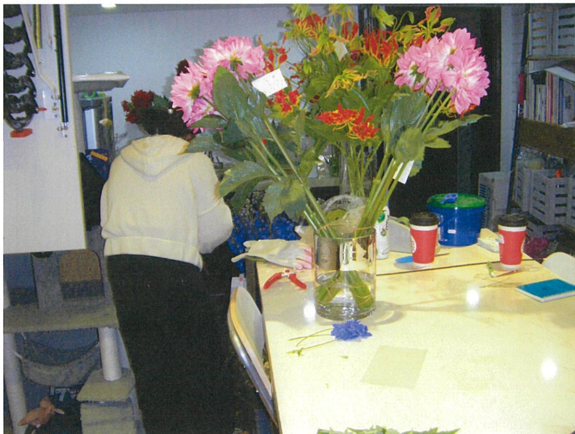
現地バイヤーへヒヤリング (A)