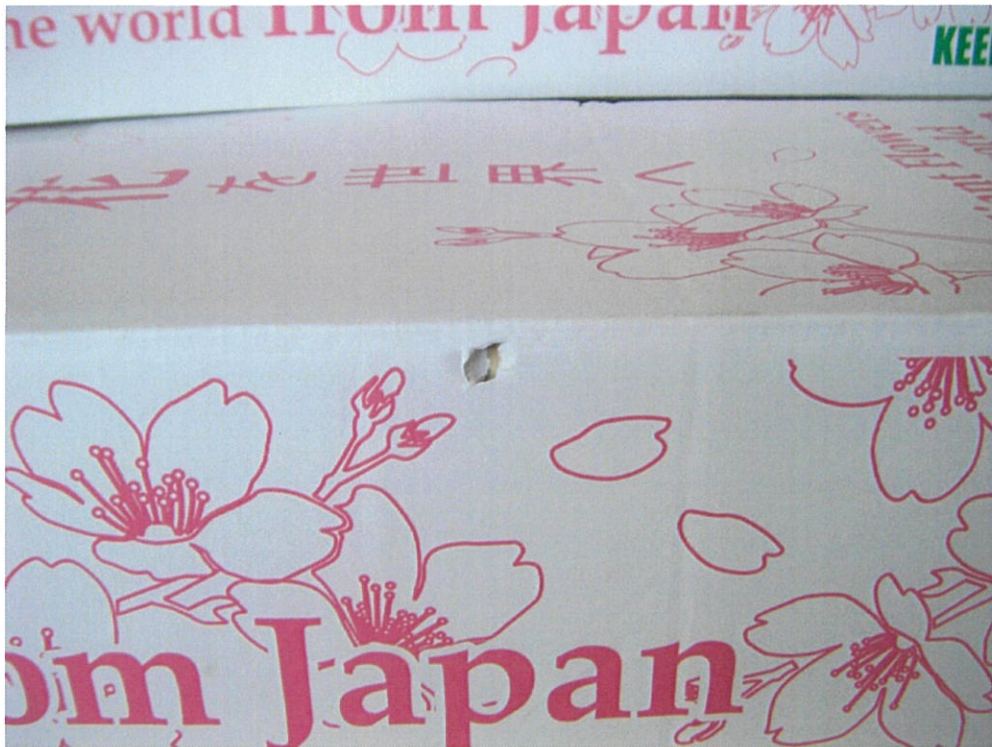
小箱は、汚れのみで破損無し