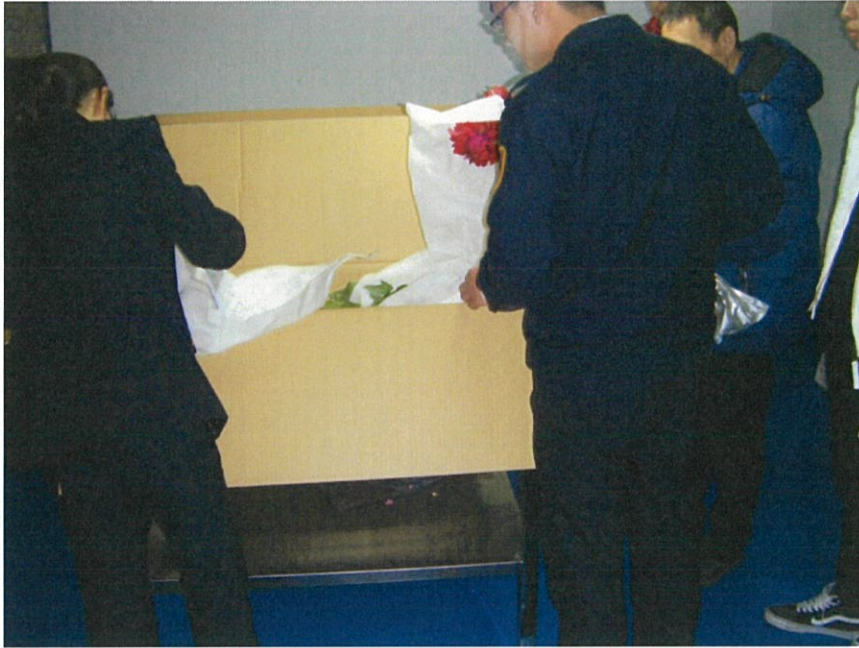
終了後 上海市内へ 取引店舗 (Aへ)