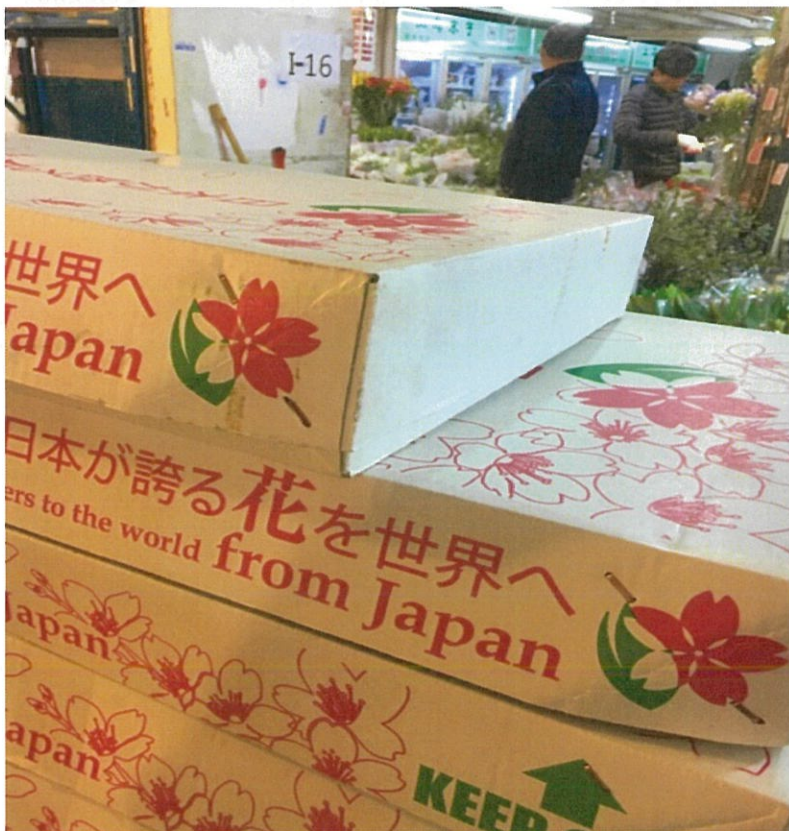
商品受け取り後、植物検疫所へ