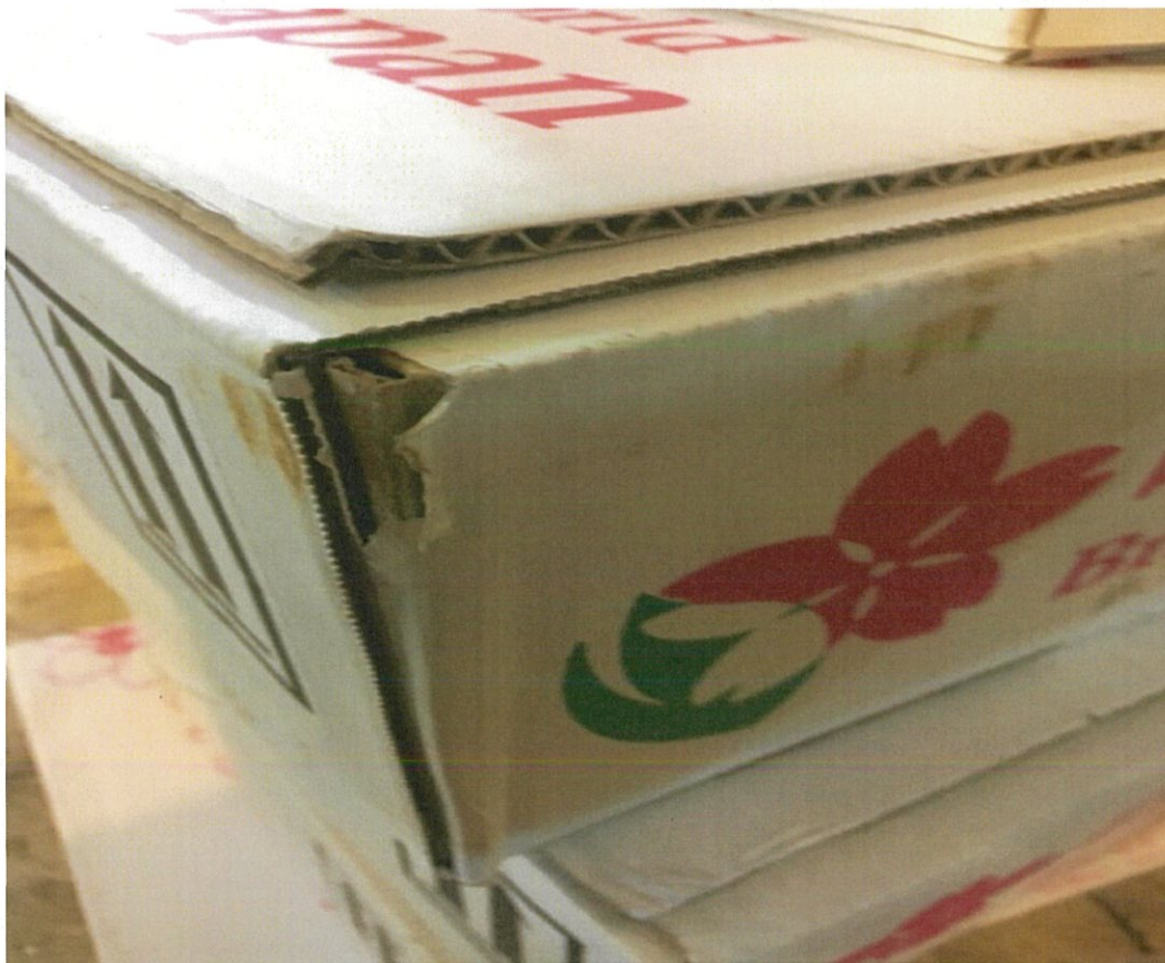
穴が開いていた 1か所のみ