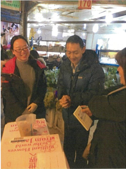
左の女性 Bの担当者にヒヤリング