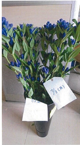
画像 34 標準 既存