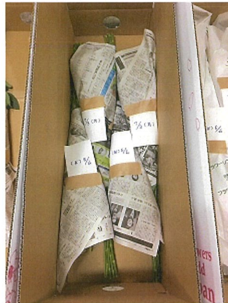
画像 5 大箱(最後)新聞紙使用