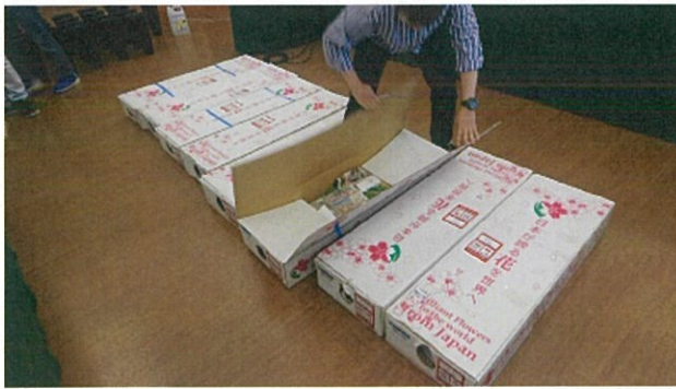
画像 17 開封の様子