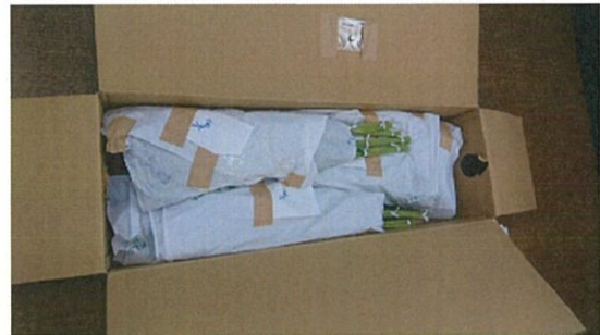
画像 20 リンドウ 1.5倍 シート