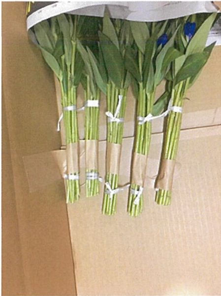
画像 4 頭突き防止の為テープにて固定