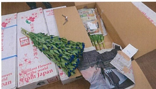
画像 19 リンドウ 標準 既存