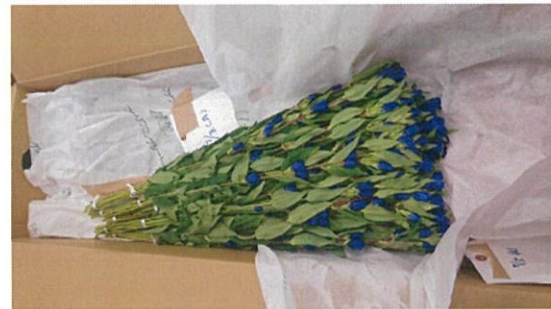
画像 22 リンドウ 1.5倍 シート