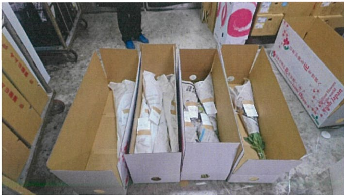
画像 6 並んだ様子