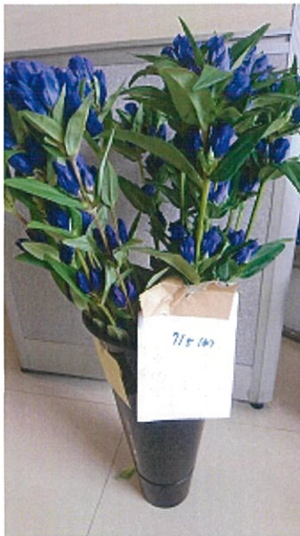
画像 33 1.5 倍 既存