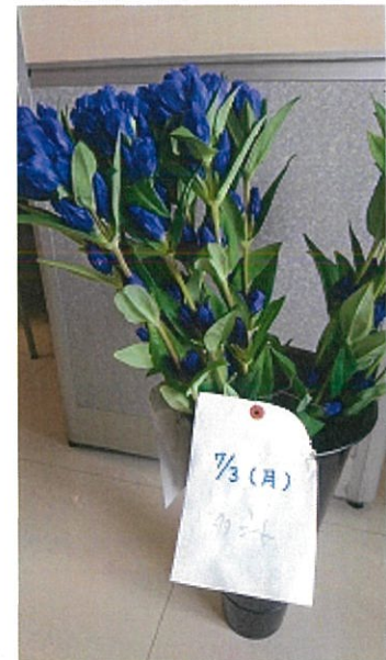
画像 32 1.5倍 シート