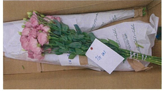
画像 26 リシアンサス 標準 シート

コメント：詰量の差では品質に大きな差は認められなかった。リブロングシートと既存の新聞紙では明らかにリブロングシートに包まれている商品が鮮度を保っていた。特に葉に大きな差があり新聞紙で梱包されたものは葉に多くの水分の付着（ムレ）が見られた。リブロングシートで梱包されたものはムレがまったく見られなかった。