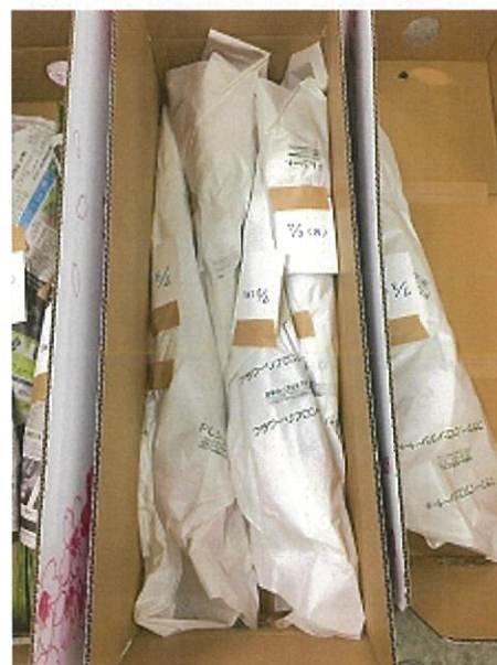
画像 3 大箱(最後)リブロングシート使用