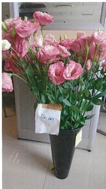
画像 30 1.5倍 既存