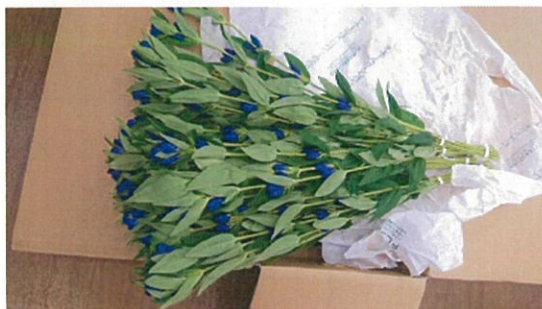
画像 21 リンドウ 標準 シート