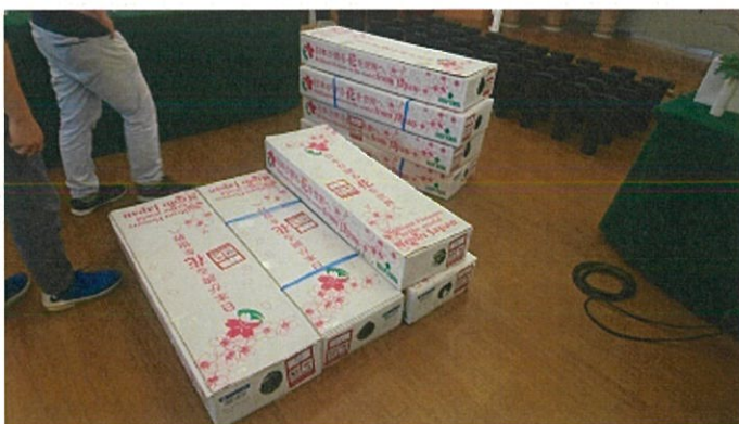
画像 7 大箱(未開封)