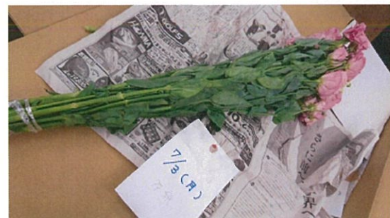
画像 24 リシアンサス 1.5倍 既存