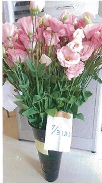
画像 28 1.5倍 シート