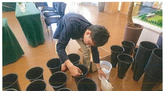
画像 16 鮮度保持剤の調査

コメント：水揚げ促進剤にスミザーズオアシスの『クイックディップ』 鮮度保持剤に『クリアエクスプレス200』を使用