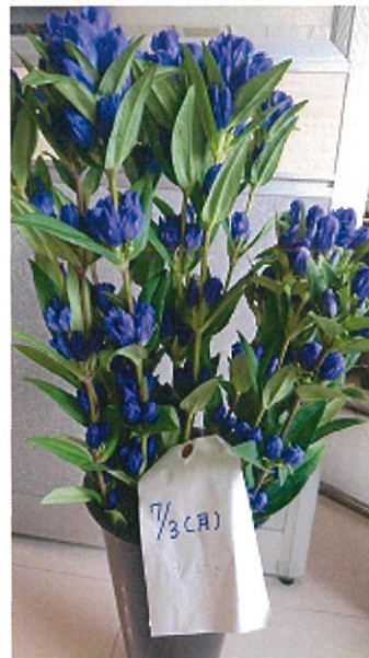
画像 31 標準 シート