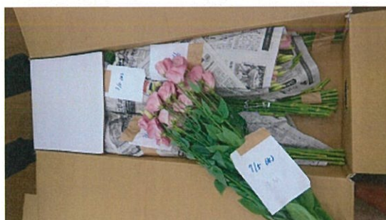
画像 23 リシアンサス 1.5倍 既存