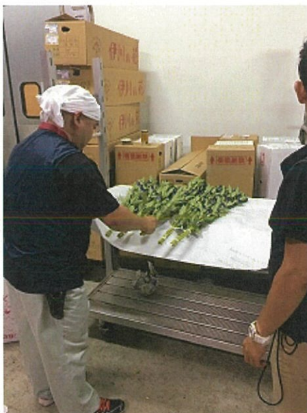
画像 2 大箱(最初)