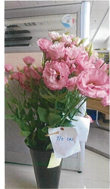
画像 29 標準 既存