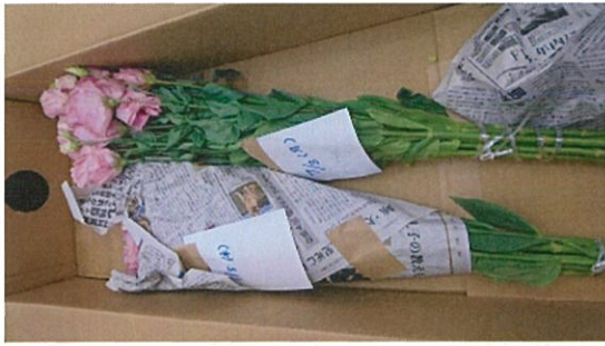
画像 25 リシアンサス 標準 既存