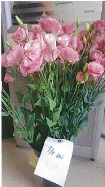
画像 27 標準 シート