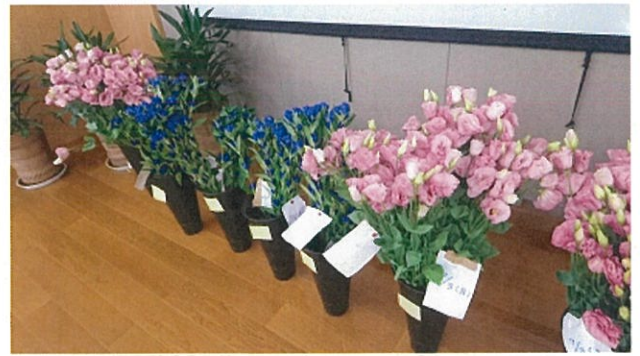
画像 18 水揚げ中

15.品質調査 同じ大きさの箱に通常量と 1.5 倍量をリパック。リブロングシート有無にて比較。それぞれに当日入荷分と前回せり日入荷分を用意し経過日数による比較も併せて実施。