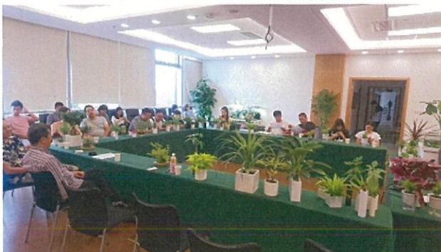
画像 15 集まったのは約 20 名