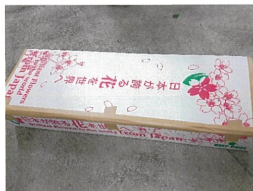
画像 4 ダンボールを台車に積載した様子（左）