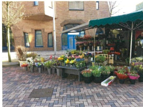
画像 11-1 店頭の様子