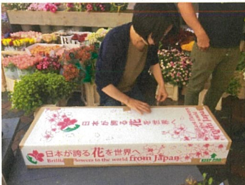
画像 10 ヒアリングの様子を撮影