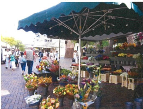
画像 11-2 店頭の様子

そこで、オランダの輸出業者が輸出時に使用し、世界の輸出国の出荷者のほとんどが使用している“弁当型タイプ”の型を検討する必要があるのではないか。“弁当型タイプ”は、大量に輸出品がある場合、特に梱包作業の作業性がよくなり、強度の面などでも効果が大きい。また、すべての場面で箱を重ねる際などにメリットがでる。そして、デザイン性やラベルの位置など自由度が広がる。世界の主流であることの検討も必要と考える。