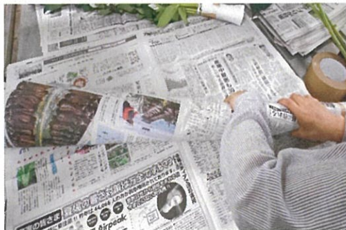
画像 2 梱包の様子