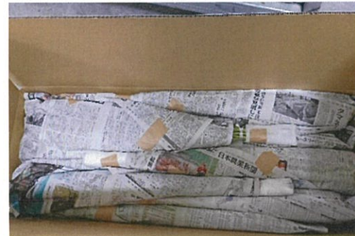
画像 3 箱詰め後

⇒フラップが大きすぎて詰めづらい。また、あまりにも固すぎるため厚み分、幅が広がってしまうため、容積が増えてしまう。ダンボールが固すぎるため無理をすると花が折れる。