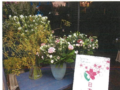
画像 12 店頭の様子